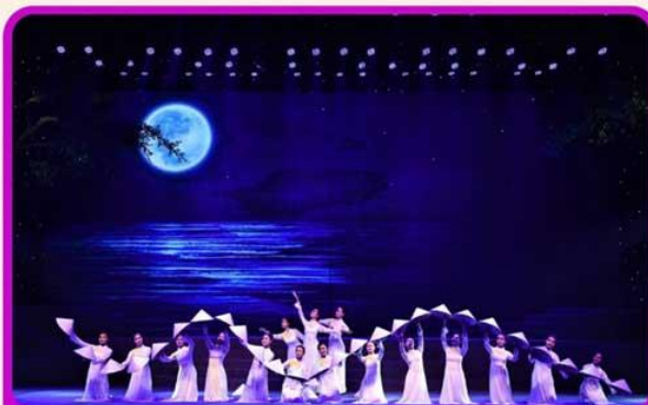
ชมการแสดง Charming Show Danang