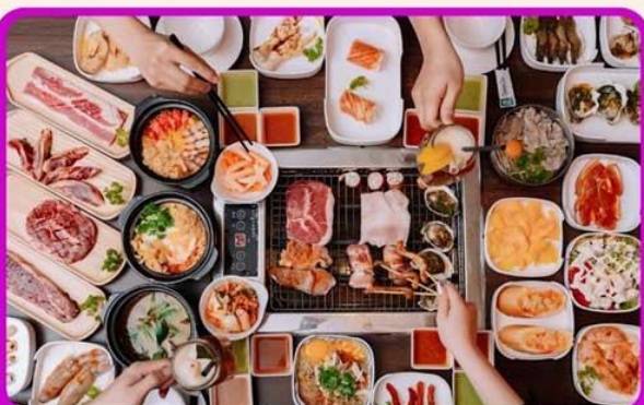
พิเศษ!! เมบูซาซิมิ+บุฟเฟ่ต์ปิ้งย่าง