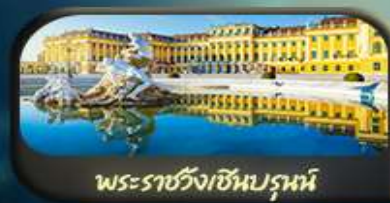
พระราชวังเชินบรุนน์