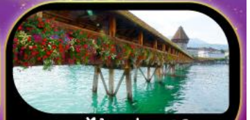
สะพานไม้ฆาปค คูซิริน