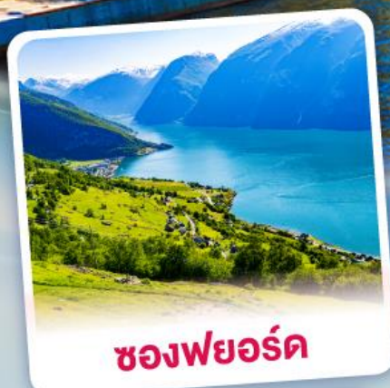
ช่องฟยอร์ด