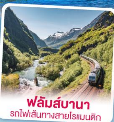
พหลิมส์บานา