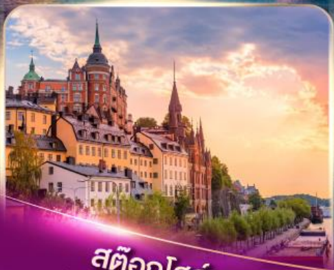
สต็อกโฮล์ม เวนิสแห่งยุโรปเหนือ