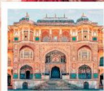
♥♦♦ Amber Fort