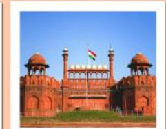
♥♦♦ Agra Fort