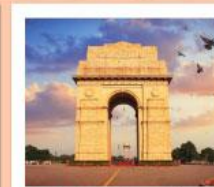
♥♦♦ India Gate