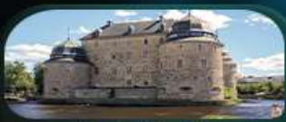
ปราสาทโอเรโบ