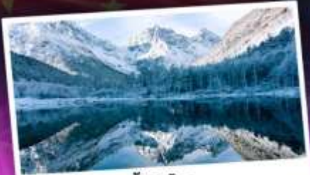
บี้ฝิงโกว

เทือกเขาแอลป์เมืองจีน "ภูเขาซีครุณี" ชมความสวยงามของอุทยานบี้ฝิงโกว