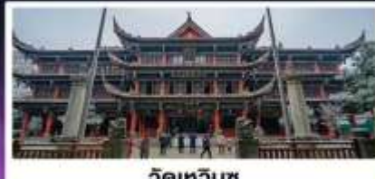
วัดเหวินซู่