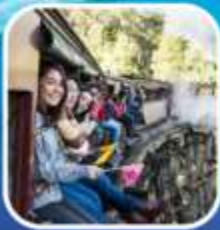
รถไฟจักรไอน้ำโบราณ