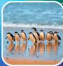
เพนกวินที่เกาะฟิลลิป