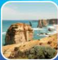
Great Ocean Road (ครึ่งสาย)