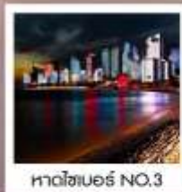
หาดไฮเบอร์ NO.3

ซิมฟรี!! ...เบียร์ชิงเต่า สูตรออริจินัลดั้งเดิม ...ท่านละ 1 แก้ว