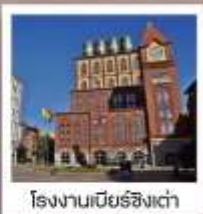
โรงแรมเบียร์ชิงเต่า