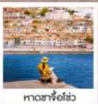
หาดซาโจ่วไฮ่

เรือยวี่ / ย่านฉินเหล่งฟาง / สวนเว่ยไห่ / WEI HAI WINDOW / ถนนฮวงวีป้า สวนหย่อมโกทอน / เมืองท่าฮวงไห่ / หอคอยตาคองคา / ชายหาดจินซา / รูปปั้นปลาฉลาม แปดเซียนข้ามถนน / หาดทรายซาโจ่วไฮ่ / หาดไฮเบอร์ NO.3 / สวนจงซาน / ถนนหลงเจียง พิพิธภัณฑ์ที่ว่าการท่าเรือ / Silver Fish St. / สะพานจินเจียว / โบสถ์ St. Emil ถนนเป่าฉ่าทวน / ห้างเว่ยซานไห่เจี้ยน NIGHT MARKET / QINGDAO HAITIAN CENTER ชั้นB1 โรงแรมเบียร์ชิงเต่า / ถนนเลียบชายหาดปิ่นไห่ผู้จ้านเต่า / ถนนคนเดินไถ่ถิง