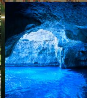
BLUE GROTTO CAPRI