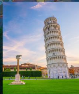
TOWER OF PISA