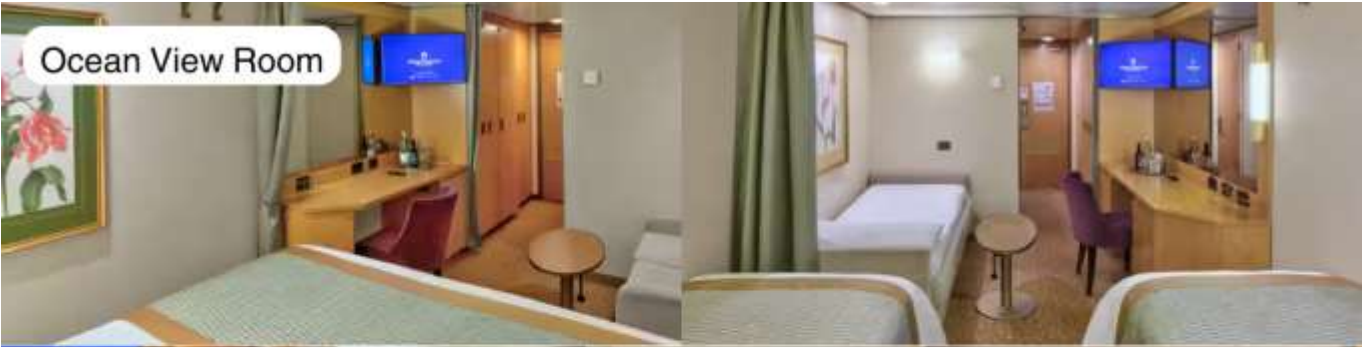
Ocean View Room