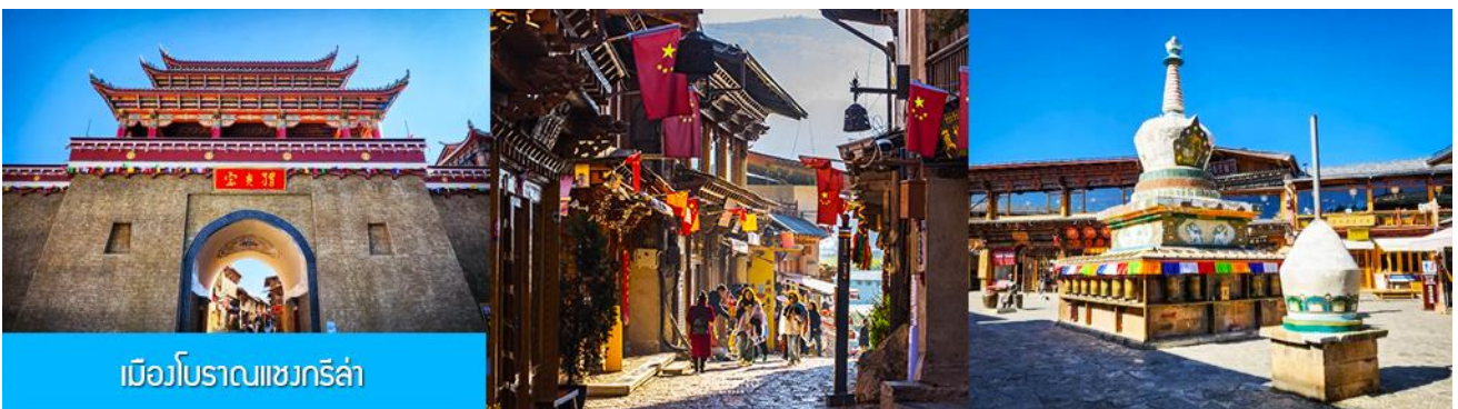
เมืองโบราณเซงกรีล่า