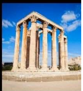
Temple Of Olympian