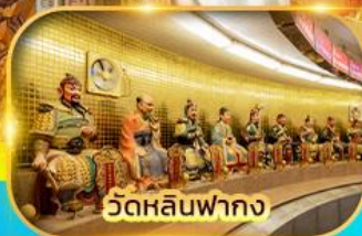
วัดหลินฟาถง