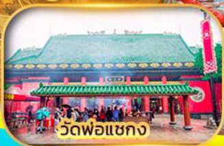
วัดพ่อแชกง