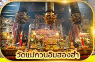
วัดแม่กวนอิมสองข่า