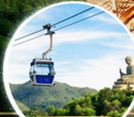
รวมกระเช้าฮ่องกง