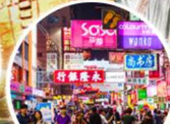
Shopping Taim Sha Tsui