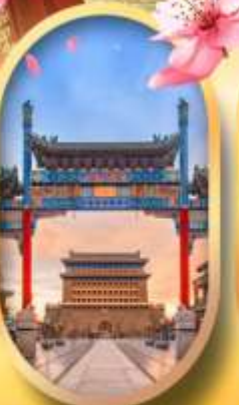
ถนนคนเดินเจียมเหมิน