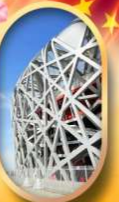
ผ่านชมสนามกีฬาโอลิมปิก