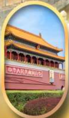
จัสมุติสเทียนอันเหมิน