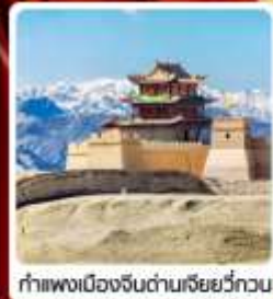
กำแพงเมืองจีนด่านเสี่ยววีกวน

• ไฮไลต์...เส้นทางสายไหม ชมสระน้ำวังพระจันทร์ ทะเลทรายผิงซาซาน กำแพงเมืองจีนด่านสุดท้าย "เจียยวีกวน" มรดกโลกภูเขาสายรุ้งจางเย่