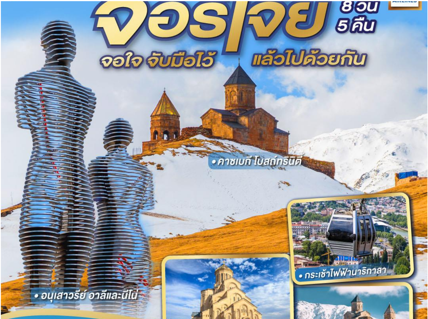
• คาซเบก โบสถ์กรินิด