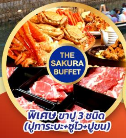
พิเศษ 3 ชนิด (ปูทะเล+ซูโม่+ปูขม)