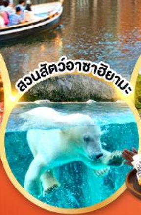
ลวนสัตว์อาซาฮิยามะ