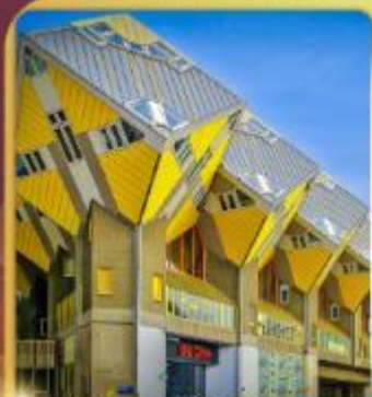
บ้านลูกเต่า โลก์คูมูส

“ล่องเรือหลังคากระจก” ชมกรุงอัมสเตอร์ดัม