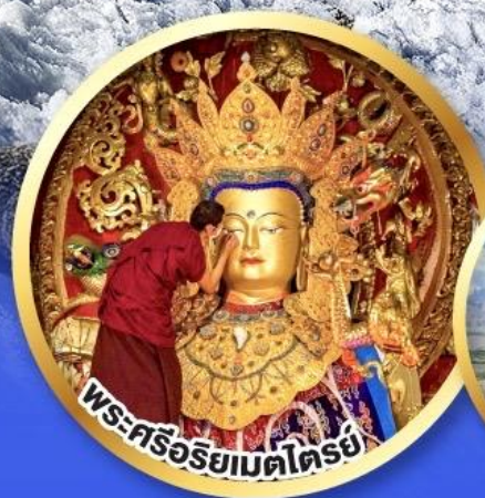
พระศรีอริยเมตไตรย์