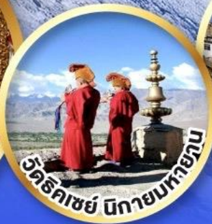
วัดธิกะชัย นิกายมหายาน