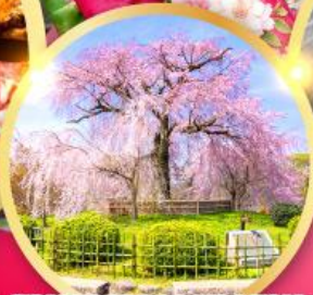
สวนสาธารณะมารุยามะ