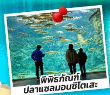
พิพิธภัณฑ์ ปลาแซลมอนชิโตเสะ

ชมซากุระจุใจ ณ สวนอาซาฮิยามะ สวนสาธารณะมารุยามะ