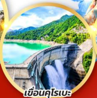
เขื่อนคุโรเบะ