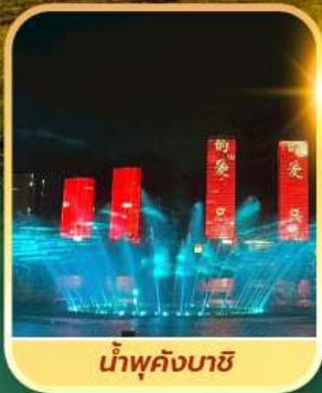
น้ำพุคังบาซี