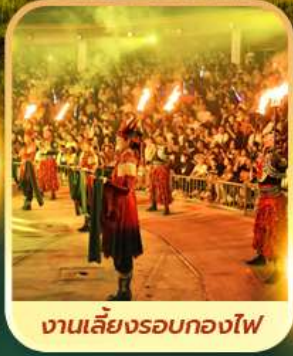
งานเลี้ยงรอบกองไฟ