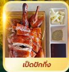
เบ็ดปักกิ้ง