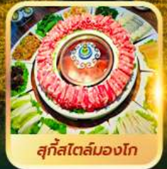
สุกีสโตลมองโก