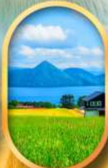
ทะเลสาบโทโยะ