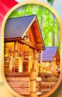
บึงเทิลเกอเรส