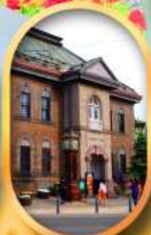
พิพิธภัณฑ์กล่องดนตรี