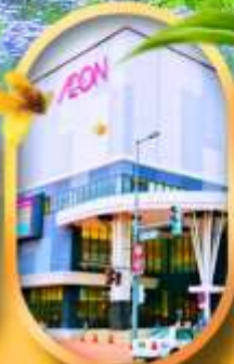
อีออนมอลล์