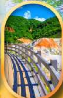
โนโบริเบ็ตสึ