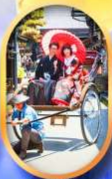
ศาลเจ้าจิ้งจอก