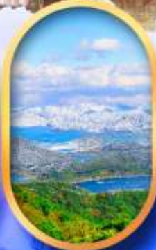
ทะเลสาบมิกะตะ