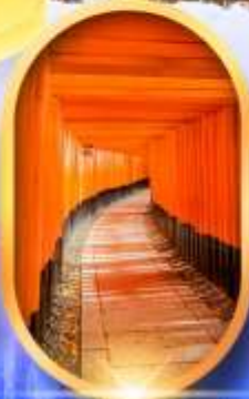
เมืองเก่าทาคายาม่า