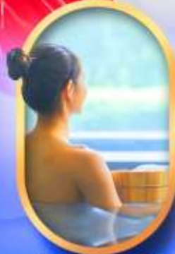
พักโรงแรมออนเซ็น