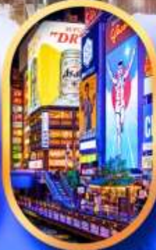
ย่านชิบะฮาชิจิ