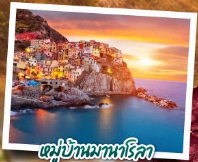
หมู่บ้านมานาโรคา