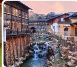
เมืองโบราณเหยahu