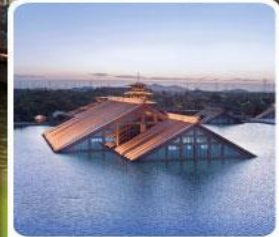
พิพิธภัณฑ์ไต้บ้ำกวงฟู่หลิน