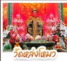
วัดเส่งไฉมว

นั่งรถรางพีคแตรมสู่ TOP OF PEAK • ช้อปปิ้งจตุจักรก๊ก และ CITYGATE OUTLAETS • นั่งกระเช้ามองปิง สักการะพระใหญ่เทียนถาน • จอพรเจ้าแม่หล่งโหมว แม่งอง 5 มังกร ให้ประสบความสำเร็จในทุกๆ ด้าน