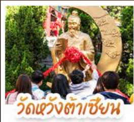
วัดเซ่งต้าเซ็ง