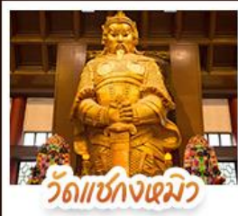
วัดเชกงไฉมว