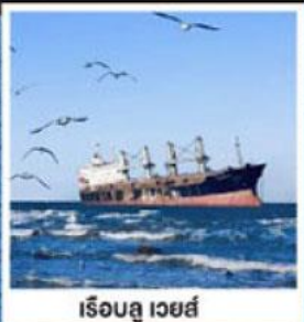
ริเออลู เวยส์