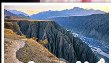
แกรนด์แคนยอนตู่ชานจื่อ