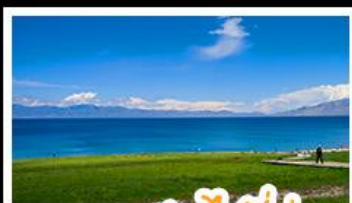
ทะเลสาบไซลีมู

หุบเขาดอกท้อ - ทะเลสาบไซลีมู แกรนด์แคนยอนตู่ชานจื่อ - ทุ่งหญ้าหาลาถิ