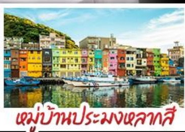
หมู่บ้านประมงเหลกาสี