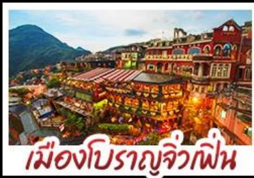
เมืองโบราณจิ่วเฟิ่น

เที่ยวธรรมชาติระดับโลก เอเชีย ทะเลสาบสุริยันจันทรา - เมืองดงครบ ไทเป จิ่วเฟิ่น - ซีเหมินติง