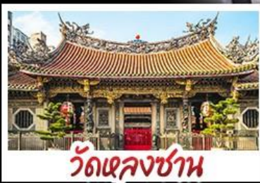
วัดเจหลงซาน