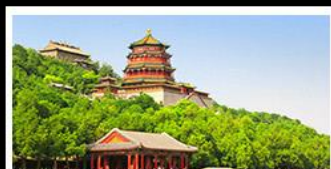
พระราชวังฤดูร้อนอี๋เหอหยวน

บ๊อพิซซเปิดปักกิ่ง สุกี้มองโก MICHELIN GUIDE ร้าน TAO TAO JU