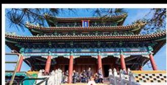
สวนจิ่งอัน