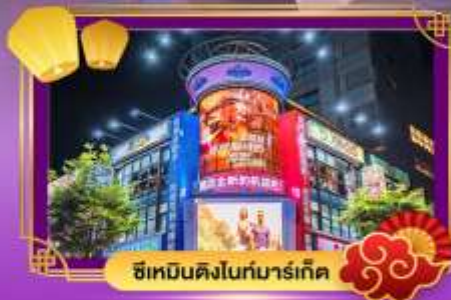
ซีเหมินดิงไนท์มาร์เก็ต