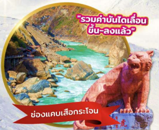
"รวมค่าบ่อนโต้เลื่อน บ่อน-ลงแล้ว"