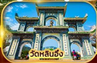
วัดหลินฮั่ง