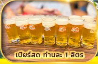
เบียร์สด ท่านละ 1 สิตร