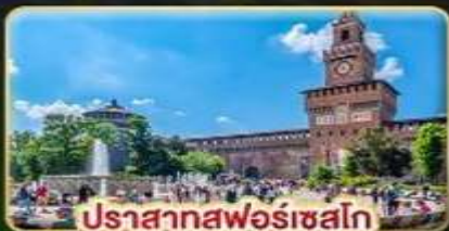
ปราสาทฟอรัสเซโก

📅 เดินทาง : 28 พ.ค. - 06 มิ.ย. | 05-14 ส.ค. 15-24 ต.ค. 69