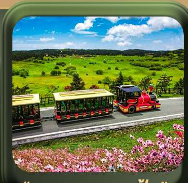
“ อุทยานเขานางฟ้า ”

T2G-CKG26CZ Special of Chongqing...วงชิง ต้าจู้ อุ้หลง อุทยานหลุมฟ้า เขานางฟ้า 5D 3N (CZ)