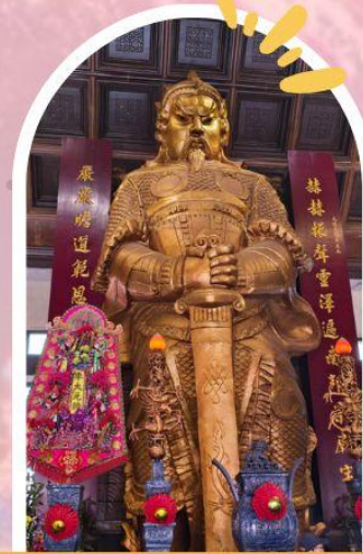
วัดแซกง ขอพรโชคลาก การเงิน และธุรกิจ