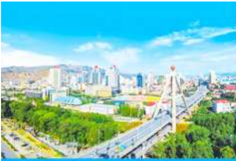
เมืองซีหนิง