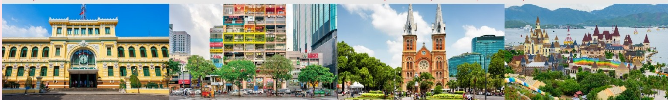
ไพรบ์นีย์กลางโฮจิมินห์