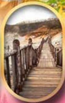
หุบเขาจิทอกุคาบิ