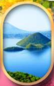
วิวทะเลสาบโทโยะ