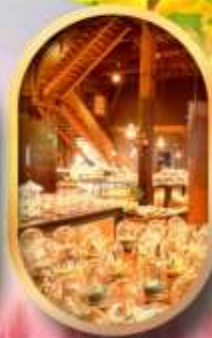
พิพิธภัณฑ์ถ้ำออนเซ็น