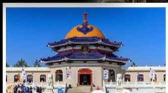
สุสานเจกิสข่าน