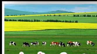
ทุ่งหญ้าเออร์ดอส

ทุ่งหญ้าเออร์ดอส สุสานเจกิสข่าน แกรนด์แคนยอนแม่น้ำเหลือง