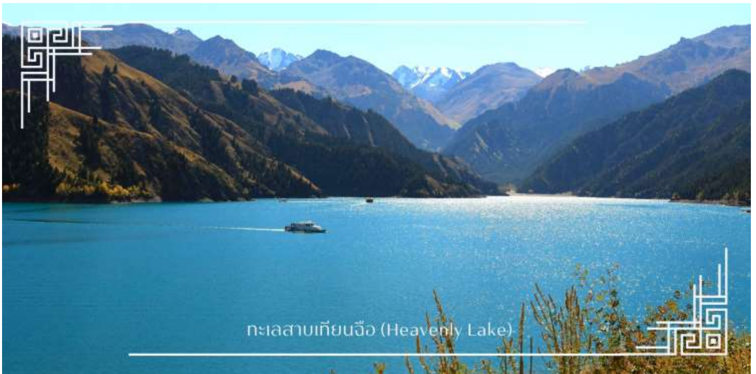
ทะเลสาบเทียนฉือ (Heavenly Lake)

นำท่าน ล่องเรือทะเลสาบเทียนฉือ (Heavenly Lake) ทะเลสาบน้ำจืดใสสะอาดราวกับกระจกเงา ท่ามกลางบรรยากาศเงียบสงบและอากาศอันบริสุทธิ์ ท่านจะได้ชมความยิ่งใหญ่ของยอดเขาที่สะท้อนเงาลงบนผืนน้ำสีมรกตอย่างใกล้ชิด มอบความรู้สึกที่ผ่อนคลายและประทับใจราวกับได้หลุดเข้าไปอยู่ในภาพวาดทิวทัศน์ระดับโลก (รวมค่าล่องเรือ)