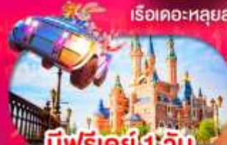
มีฟรีเคย์ 1 วัน