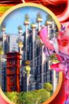
อาคารพันดับไม้