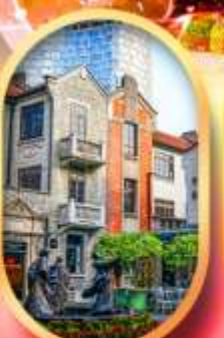
ย่านซินเกียนตี้