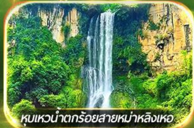
หุบเขาน้ำตกร้อยสายหม่าหลิงเหอ

ชมป่าภูเขาหมื่นยอด, เที่ยวหมู่บ้านโบราณหลินปู้อี ล่องเรือทะเลสาบว่างเฟิงหู, ชมสวนดอกไม้ตามฤดูกาล