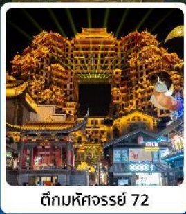
ตึกหอคจรรย 72