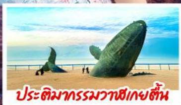
ประติมากรรมวาฬยกตื่น