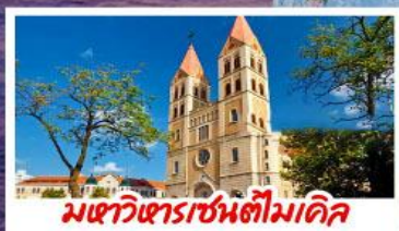
มหาวิหารเซนต์โมเคิล