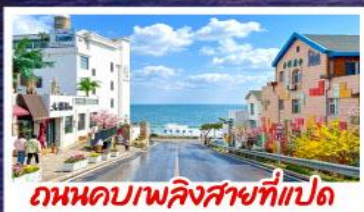
ถนนคอปเปลิงสาขาที่แปด