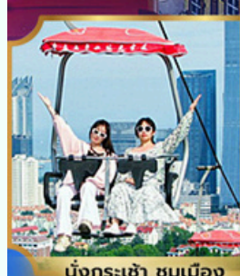
นั่งกระเช้า ชมเมือง