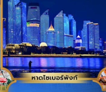
หาดโซเบอร์ฟังก์