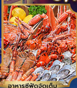
อาหารซีฟู้ดจัดเต็ม

บุฟเฟ่ต์เบียร์ไม่อื่น + ซีฟู้ด + บิงย่างเกาหลี